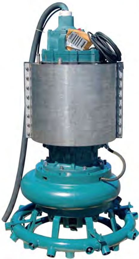
BOMBA MODELO TBM200MH-PBO CON OPCIONES DE CAMISAS DE ENFRIAMIENTO (AGUA) Y ANILLO DE CHORROS A PRESION